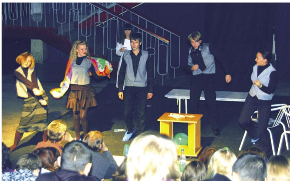
Фестиваль-конкурс молодых режиссеров самодеятельных театров «Дебют». Спектакль по современной драматургии

И здесь заметим: хобби, увлечение хореографией, вокалом или театром не мешает учёбе, а скорее заставляет дисциплинироваться, учит распределять свои силы так, чтобы на всё хватало времени. Участники самодельности, как прави-