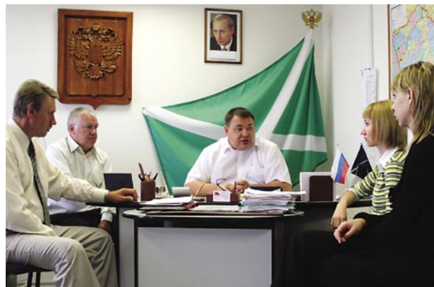
Дискуссия на кафедре таможенного дела и внешнеэкономической деятельности