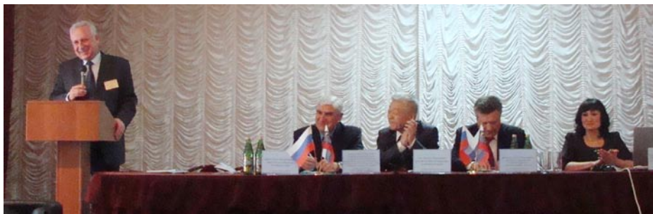
На пленарном заседании

Несмотря на столь значимые результаты конференции нашему вузу еще есть к чему стремиться. И каждый из нас может внести свой вклад в развитие науки на Алтае.