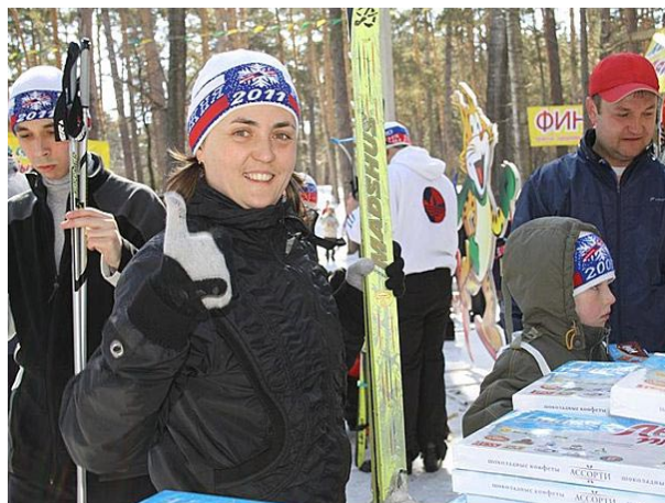
Закрытие лыжного сезона

Прошла зима, пришло время закрытия лыжного сезона. Студенты Алтайской академии экономики и права с удовольствием приняли участие в этом мероприятии, которое прошло на лыжной базе «Динамо». «Мероприятия по лыжному спорту всегда проходят весело и позитивно. Можно прекрасно провести время, пообщаться, поболеть за своих» – прокомментировали студенты.