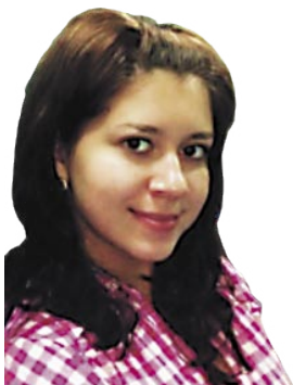
от Виктории Клаченковой

Позади остался еще один насыщенный спортивными мероприятиями месяц. Он принес много побед и почетных мест студентам ААЭП.